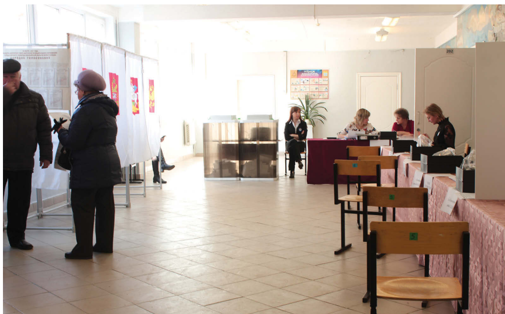
Голосование на участке в подмосковных Люберцах в 2017 году

Подготовка властей к выборам глав регионов вряд ли ограничится досрочными отставками и заменами действующих губернаторов, как опытных, но пожилых, так и молодых, но плохо избираемых. На сей раз в условиях роста протестных настроений, снижения популярности «Единой России» и Путина и с учетом опыта выборов 2018 года (неожиданных поражений кандидатов от власти) власти лучше подготовятся к выборам, чтобы избежать неожиданностей: например, подберут нужных соперников своим протеже, которые в основном пойдут на выборы как самовыдвиженцы, а не от «Единой России»; поддержат их через финансовые вливания в регионы, новые инвестиционные проекты и т.д. Жестче будет проходить регистрация кандидатов, а также задействован будет муниципальный фильтр, чтобы не допустить к выборам кандидатов, имеющих определенные шансы на победу. Представляется, что власти в регионах будут в основном вести кампании с упором на перспективы развития, которые смогут обеспечить новые назначенцы-управленцы, а возможные современные и прошлые проблемы спишут на недостатки старых руководителей. Одновременно будут подчеркиваться неопытность «протестных» кандидатов, которым удастся зарегистрироваться (среди них будут в основном представители КПРФ). При помощи таких подходов кандидаты от власти надеются победить, хотя результаты свыше 60% окажутся редкими. Вторые туры Кремль постарается не допустить, так как в таком случае велика вероятность победы «протестных» кандидатов.