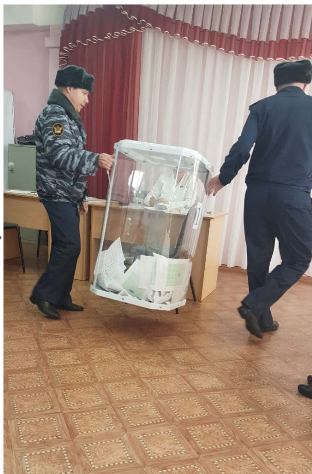
Голосование на выборах Президента 2018 в Оренбургской области

На наш взгляд, проблемными субъектами, где кандидаты власти могут столкнуться с проблемами избираемости на выборах в 2019 г., могут оказаться Забайкальский край, Астраханская, Вологодская, Курганская, Оренбургская и Челябинская области. В них сумма голосов системной оппозиции на думских выборах 2016 г. превышала голоса «Единой России».