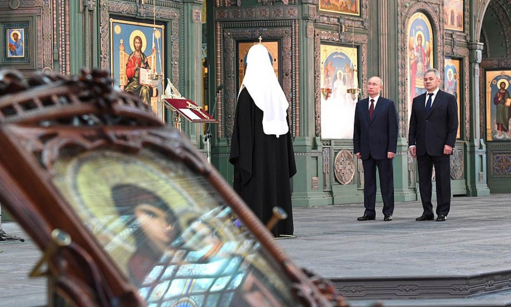
Патриарший собор Русской православной церкви во имя Воскресения Христова – Главный храм Вооружённых Сил Российской Федерации, 2020

конфессий или вовсе перестав вмешиваться в религиозные вопросы.