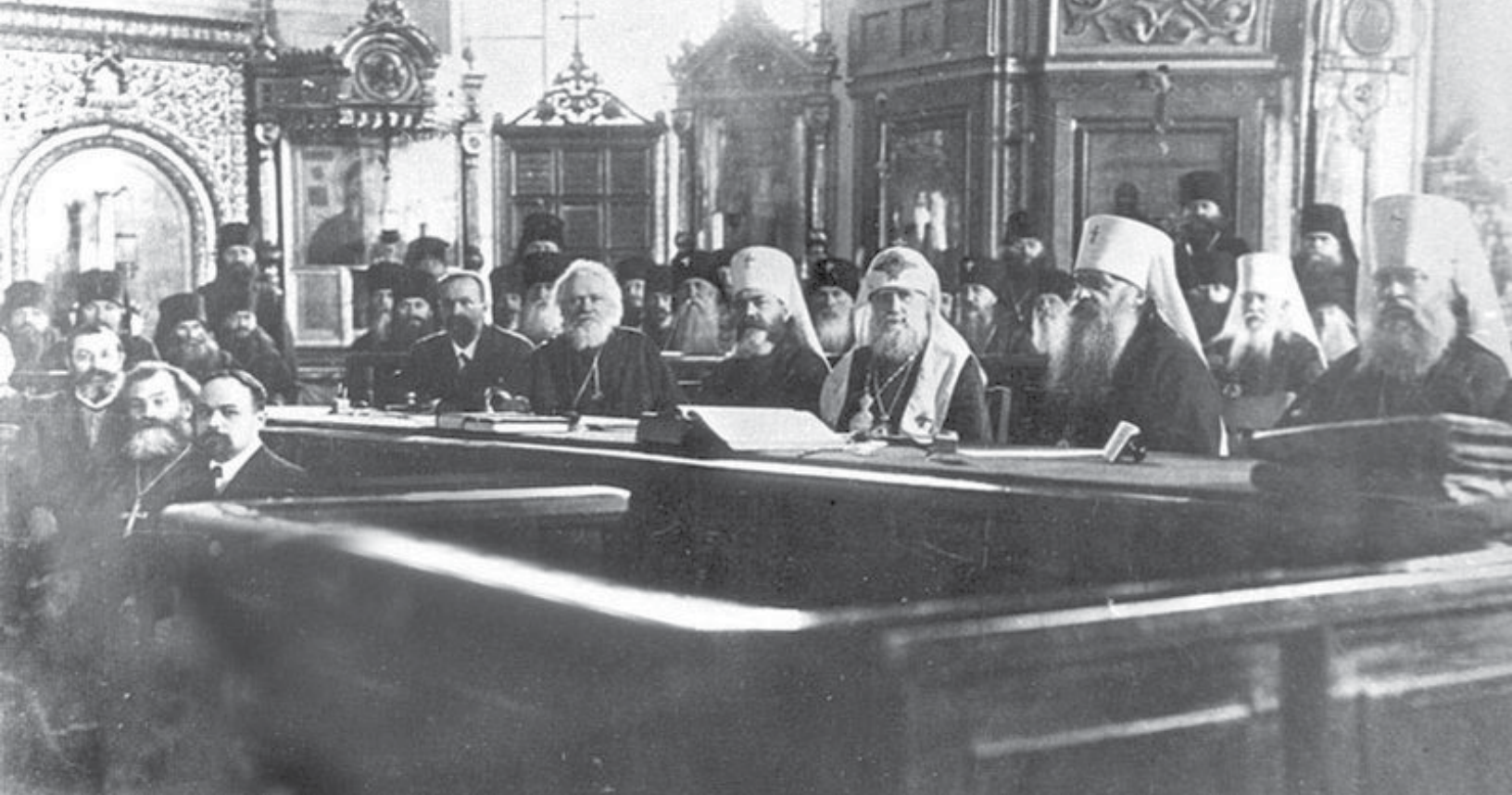
Заседание Поместного собора Русской православной церкви, 1917, Фото: Поместный собор Православной Российской Церкви (1917—1918)

зданий — например, Исаакиевский собор в Санкт-Петербурге находился в управлении МВД Российской империи.